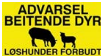
BEITENDE DYR SKILT