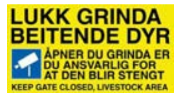
LUKK GRINDA SKILT